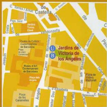
Jardins de Victoria de los Ángeles

Dissabte, 3 de febrer de 2007 a les 17 hores.