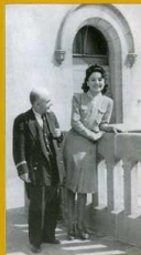
Victoria de los Ángeles amb el seu pare.